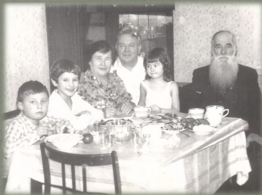
Прадедушка (справа) с родственниками